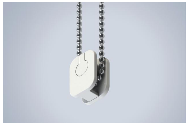
De standaard cord retainer