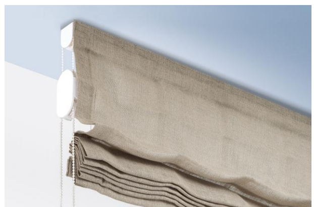
Vouwgordijn systeem met child safety device