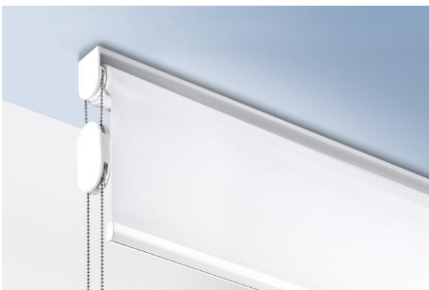
Silent Gliss child safety device –voor absolute veiligheid!

Innovaties door Silent Gliss – voor meer veiligheid in huis!